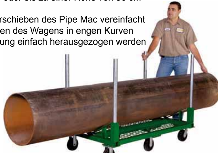
Transport eines 500mm Rohres