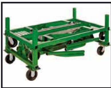
Pipe Mac lässt sich mit anderen Pipe Macs stapeln